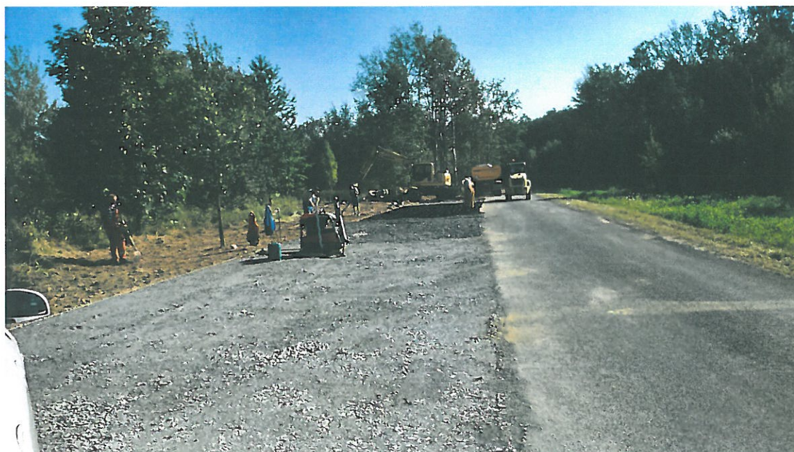
Wzdłuż drogi dojazdowej do polany.