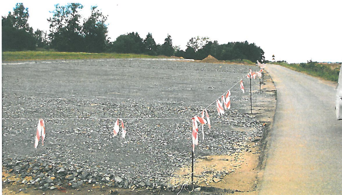
Na zdjęciu teren przeznaczony pod imprezy plenerowe i miejsca postojowe (warstwa spodnia)